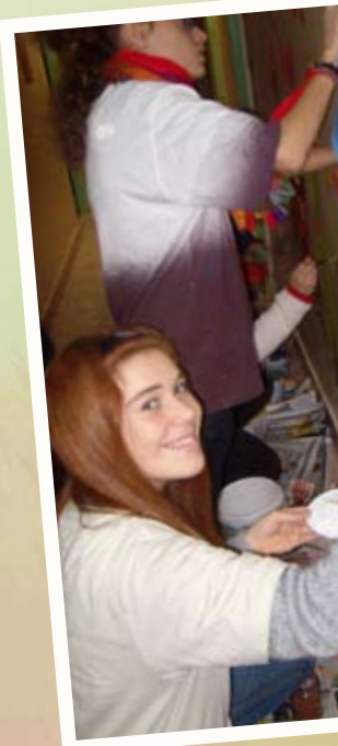
Mural u Domu za