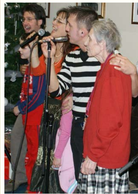
Dom za starije u Veroni