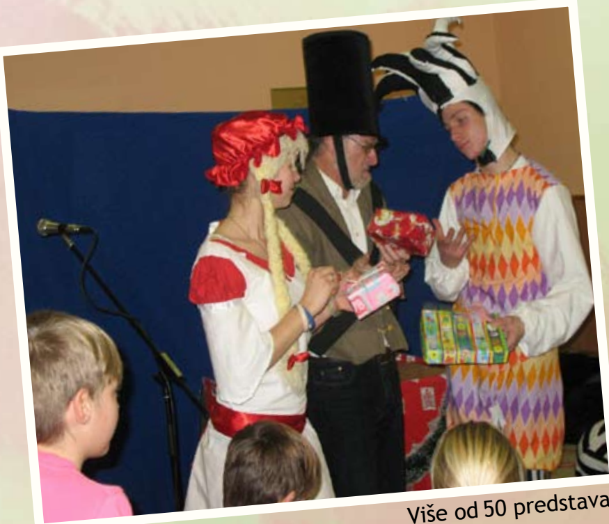
Više od 50 predstava