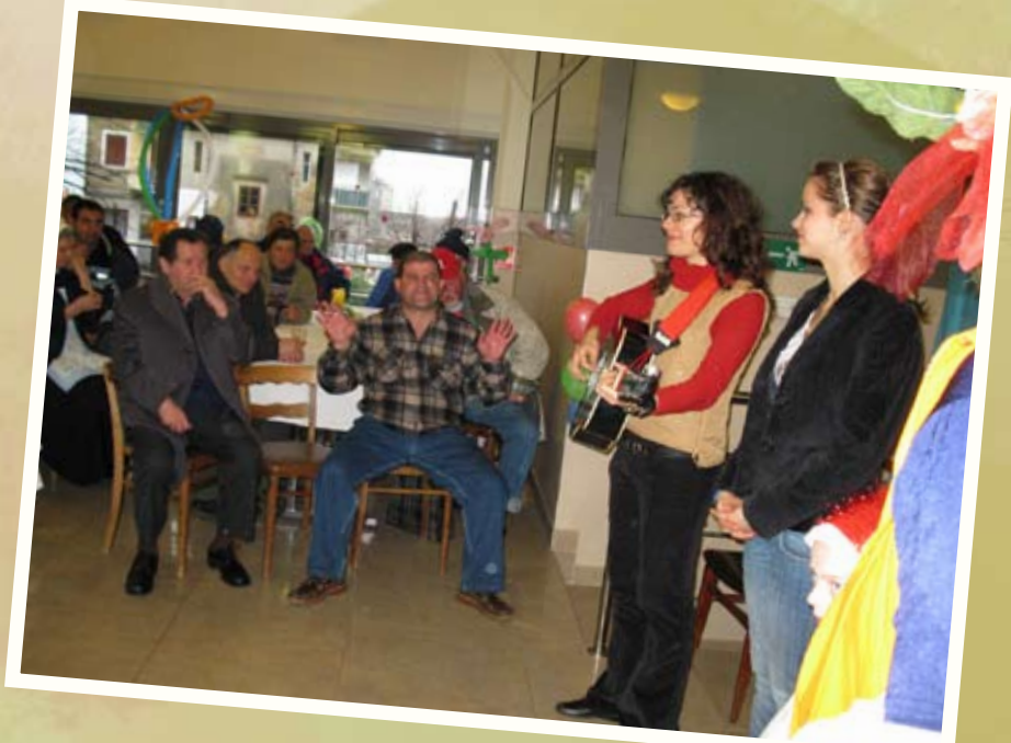
Pučko utočište, Rijeka