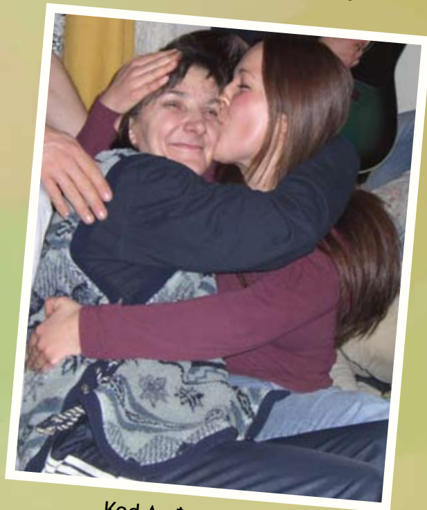
Kod Anđe u Vojniću