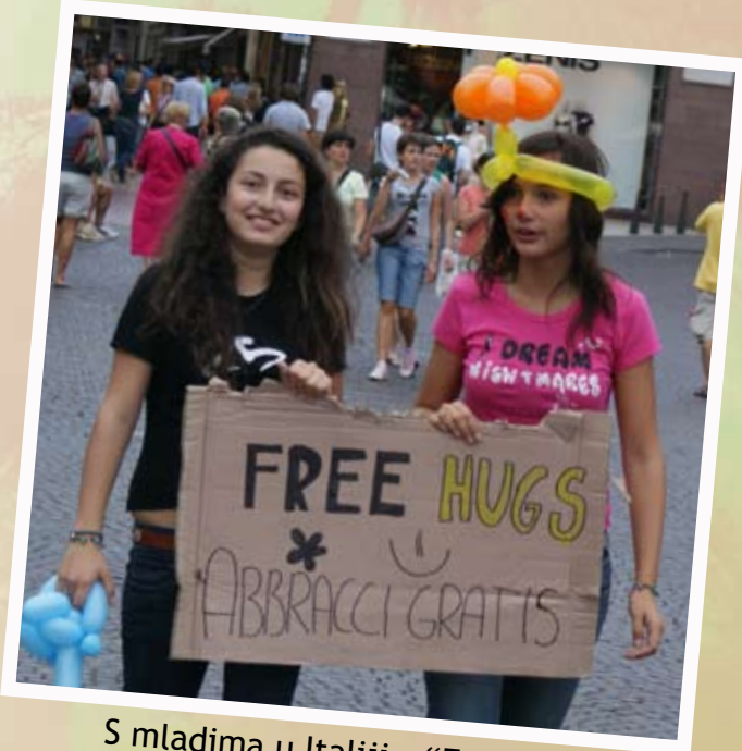
S mladima u Italiji - "Free hugs"