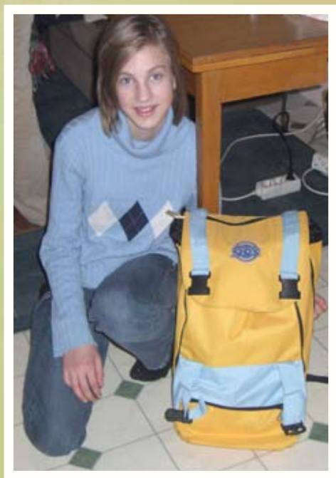
Obiteljska posjeta u Karlovcu