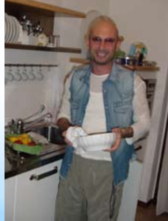
Gostoprimstvo - služba drugima!

sebe i svoje potrebe stavlja na prvo mjesto. Ali kada gradiš mostove, otvaraš se drugima, komuniciraš s njima, i ako imaš neki problem, rješavaš ga zajedno s njima. Tvoj se život obogaćuje toplinom, prijateljstvom, ljubavlju i drugim blagoslovima.”